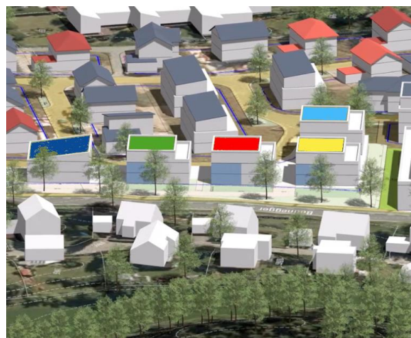
Ansicht von Westen (von der Bodnegger Straße)