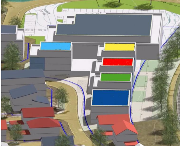
Ansicht von Norden (teilweise Bergsicht)