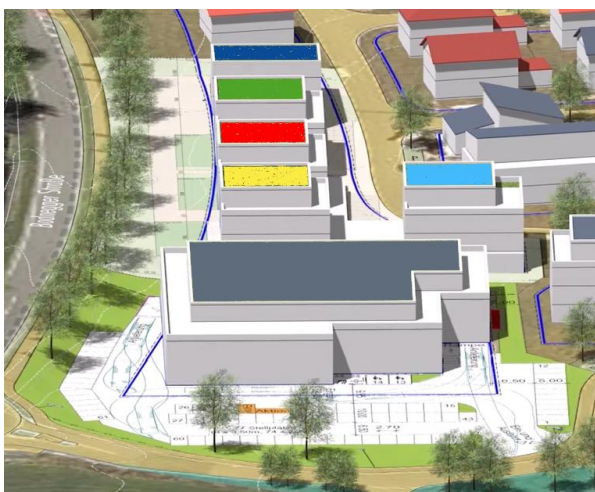
Ansicht von Süden (teilweise Sicht auf die Burg)