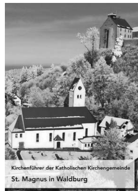
Kirchenführer der Katholischen Kirchengemeinde St. Magnus in Waldburg