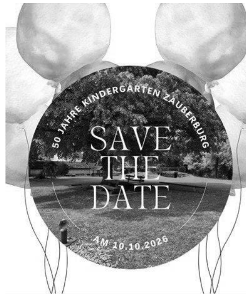
50 Jahre Kindergarten Zauberburg - das möchten wir mit Ihnen gemeinsam feiern. Wir laden Sie recht

Zur Vorbereitung unseres Festes haben wir einen Fragebogen erstellt, den Sie gerne direkt im Kindergarten abholen oder per Mail zb-stvleitung@gemeinde-waldburg.de erfragen können. Über eine rege Teilnahme würden wir uns sehr freuen.