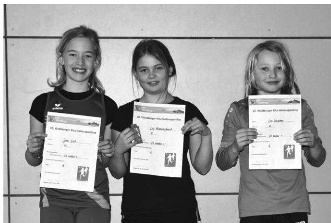
Unsere KiLa-Mannschaft der U12