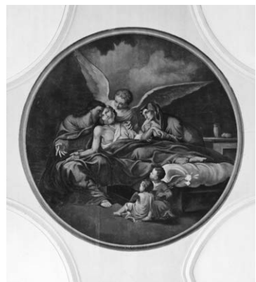
Entschlafung des hl. Josef mit Jesus und Maria an der Seite