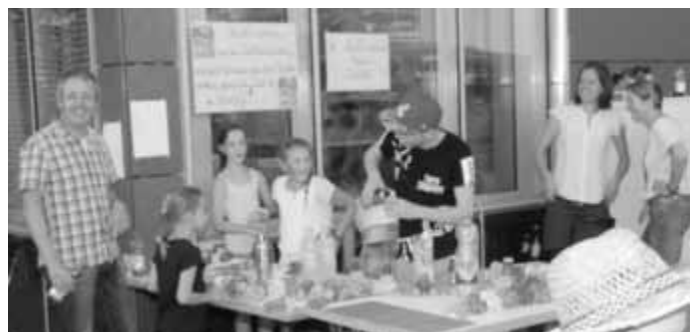
Mit leckeren Cocktails für sauberes Trinkwasser: Der SMV-Stand für die UNICEF-Spendenaktion.

Beim Schulfest der Gemeinschaftsschule Waldburg-Vogt am Ende des letzten Schuljahres drehte sich alles um das Thema „sauberes Wasser“. Die Schüler der SMV nahmen sich vor, ihre Einnahmen komplett an UNICEF zu spenden, damit Kinder auf der ganzen Welt die Möglichkeit bekommen können, sauberes Wasser zu trinken. Durch den selbstorganisierten Verkauf von Cocktails konnten 170 Euro verdient werden.