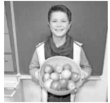
Obst ist gesund, lecker und macht Spaß! Das Schulfruchtprogramm macht's möglich.

Das Schulfruchtprogramm an den beiden Vogter Schulen wird zu 75% von der EU, der Rest über private Sponsoren und die Stiftung „Kompetenzzentrum Obstbau-Bodensee“ (KOB) finanziert. Unter den privaten Spendern befindet sich ein sehr großzügiger anonymer Sponsor aus Vogt, bei dem sich die Grund- und die Gemeinschaftsschule, vor allem aber die Schülerinnen und Schüler unserer Schulen, auf diesem Wege herzlich bedanken möchten!