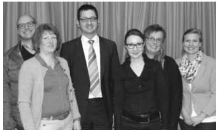
Vorstand und Geschäftsstellen-Team der LEADER-Aktionsgruppe Württembergisches Allgäu

Der nächste Projektauftrag der LEADER-Aktionsgruppe Württembergisches Allgäu ist im Frühsommer dieses Jahres geplant. Jeder, der eine Idee zur zukunftsweisenden Entwicklung unserer Region hat oder gerne im Verein Regionalentwicklung Württembergisches Allgäu aktiv werden möchte, kann sich an die LEADER-Geschäftsstelle (Tel. 07563-936-700 oder -701) wenden. Nähere Informationen zum LEADER-Förderprogramm finden Sie auch unter www.wuerttembergisches-allgaeu.eu