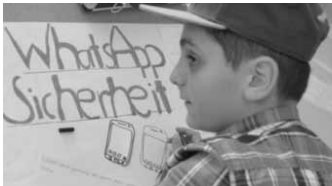
Momentaufnahme aus der Arbeitsphase am Teilthema „WhatsApp Sicherheit“.